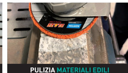
PULIZIA MATERIALI EDILI