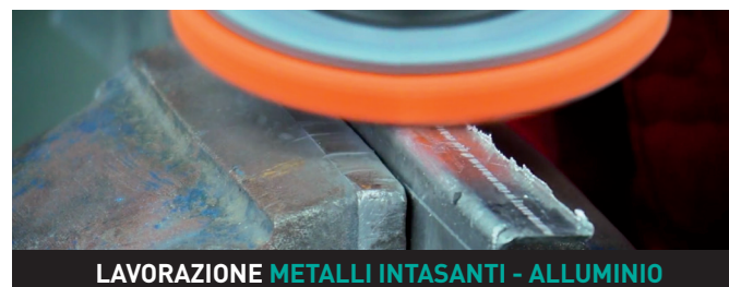
LAVORAZIONE METALLI INTASANTI - ALLUMINIO